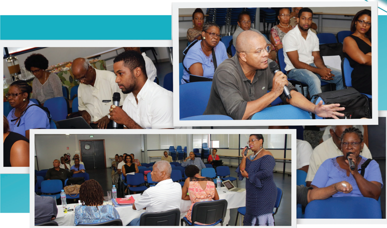
Création : M.R Graphik/ crédits photos : ARS Guadeloupe