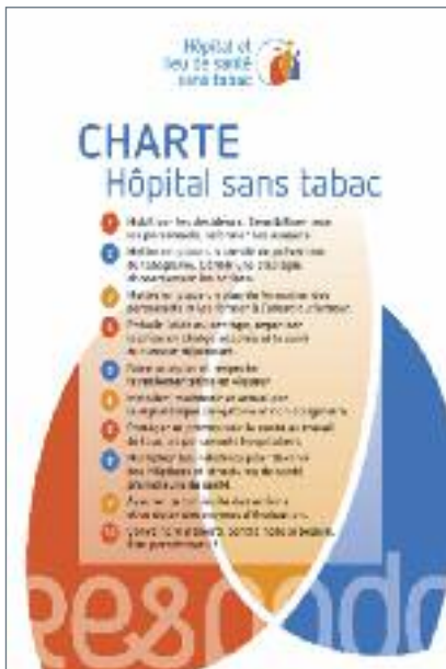
2017 : Charte Hôpital sans tabac