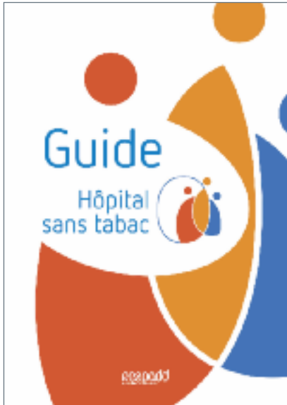
2017 : Guide Hôpital sans tabac

Les autres outils du RESPADD concernant la démarche « Lieu de santé sans tabac »