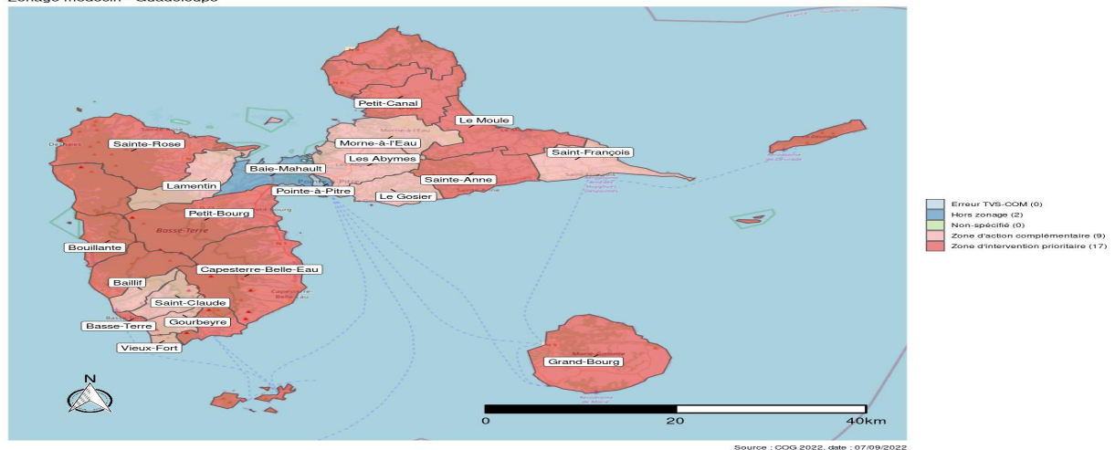
Zonage médecin - Guadeloupe