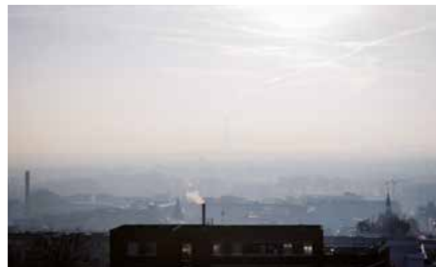
Les particules fines, l'ozone et les oxydes d'azote sont les principales composantes du « smog », brume plus ou moins dense dans les zones urbaines.

Lors des pics de pollution, la population est très attentive à la qualité de l'air, mais il faut retenir que c'est la pollution régulière et sur une longue durée , même à des niveaux de pollution modérés, qui a le plus d'effets sur la santé.