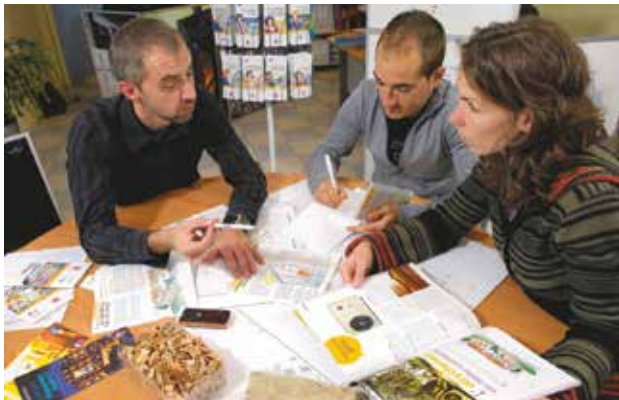
Les conseillers des Points rénovation info service vous reçoivent pour vous aider à monter votre projet de rénovation.

rejets domestiques de polluants ; • informe, accompagne et conseille les particuliers dans leur choix de systèmes de chauffage performants et peu polluants ; • encourage le renouvellement des appareils de chauffage au bois non performants.