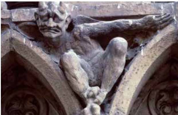
Le patrimoine bâti peut être dégradé par la pollution atmosphérique.

La pollution de l'air salit et dégrade les matériaux et les bâtiments : formation de croûtes noires sur les façades, dissolution des pierres, notamment calcaires, sous l'effet des pluies acides... Les atteintes au patrimoine bâti sont parfois irréversibles et de coûteux travaux de ravalement et de rénovation sont nécessaires.