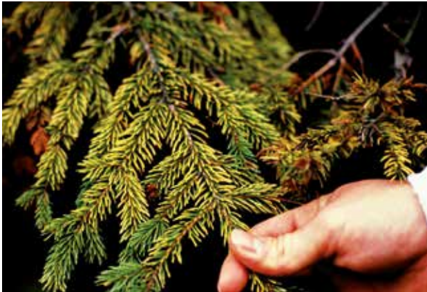
Jaunissement des aiguilles de conifères dû aux pluies acides.

Les dommages visuels dus aux effets à court terme de l'ozone sont aussi une gêne notable sur la valeur marchande des plantes cultivées sensibles à l'ozone.